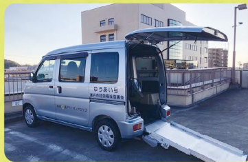
車いすスロープ付き軽自動車の貸し出し