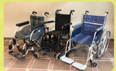
車いすの貸し出し