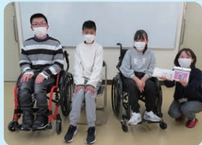
瀬戸特別支援学校の生徒の皆さん

ご協力いただきました 市民の皆さま、 店舗の皆さま、 本当にありがとう ございました!!