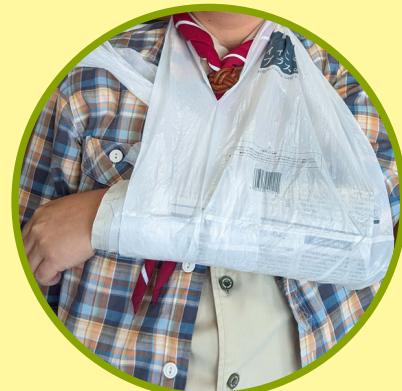
瀬戸スカウト協議会