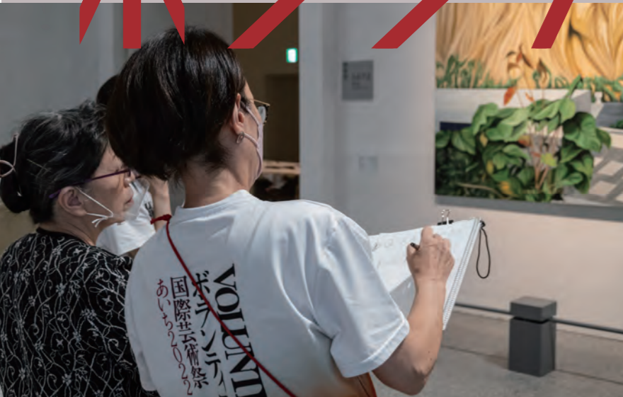
国際芸術祭「あいち2022」筆談ツアー