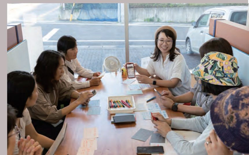
ラーニング専門研修のイメージ