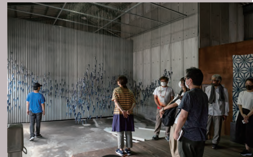
ボランティアによるツアーの様子