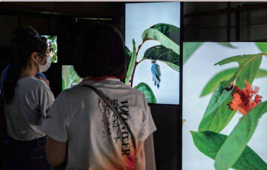
国際芸術祭「あいち2022」ボランティアによるガイドツアー