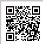
ボランティア募集ページ

※応募受付の完了後、メールで、その旨を順次通知します。 ※上記の方法による申込みができない場合は、国際芸術祭「あいち2025」ボランティア事務局までお問い合わせください。