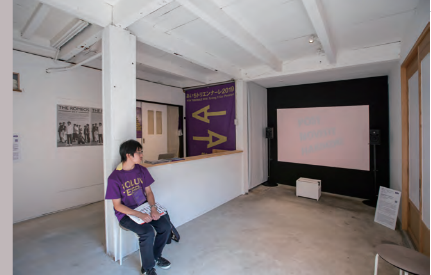
会場運営サポートの様子

鑑賞体験をテーマにしたグループの場合、鑑賞とディスカッションをセットにした鑑賞体験プログラム等を受講し、多様な作品解釈について学びます。