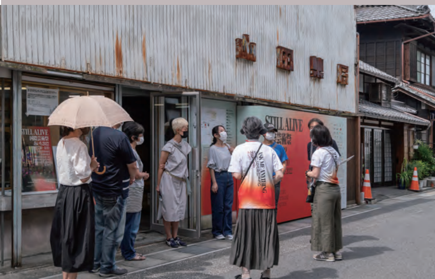
国際芸術祭「あいち2022」ボランティアによるガイドツアー